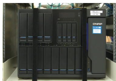
映像編集作業で生成された映像データの保存に活用されるQNAP TS-1685

また東海サービスセンターの開設に伴い、複数拠点からのアクセスが必要となるが、旧ファイルサーバーはネットワークに対応できなかったことも課題となっていた。