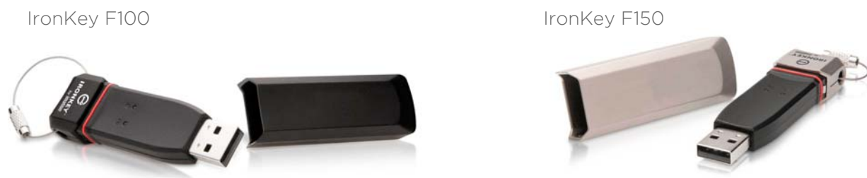
図 1: デバイス

IronKey™ F100 と IronKey™ F150 は、パスワード セキュリティ およびデータ暗号化が組み込まれた USB (ユニバーサルシリアルバス) ポータブルフラッシュドライブです。本製品は、ホスト コンピュータに直接接続されている必要があり、同梱のケーブルのみを使用して、適切に接続する必要があります。中間ハードウェアを介した接続または代替のケーブルでは、製品の元の設計と認証外の電気放出が生じる可能性があります。