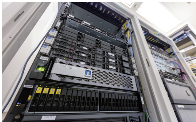
本社サーバールームの仮想環境のストレージとして稼働するQNAP ES2486dcおよびQNAP TS-h1283XU-RP

それまで運用していたストレージは社内共有環境専用機として稼働させ、業務システムが稼働する仮想サーバーのバックアップ用のストレージについては、新しい機器を導入することになった。